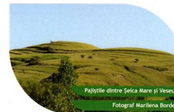
Pajiștile dintre Șeica Mare și Veseud